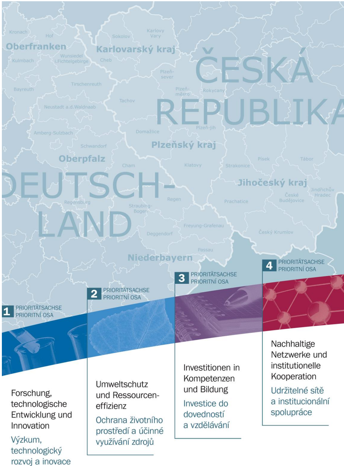
Obrázek 4 | Mapa dotačního území s piktogramy a názvy prioritních os programu